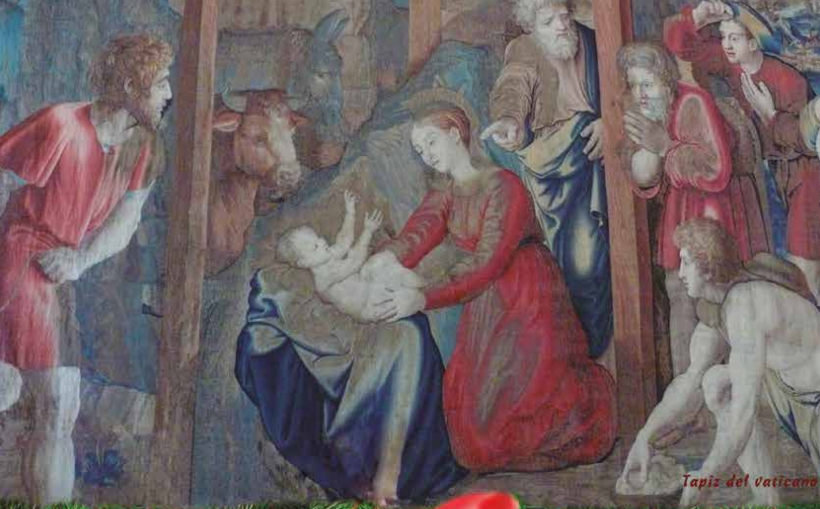
Tapiz del Vaticano